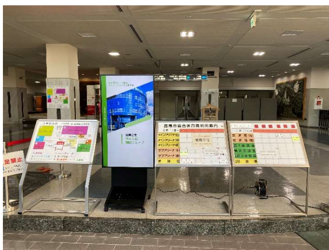
体育館ロビー内での企業PR写真