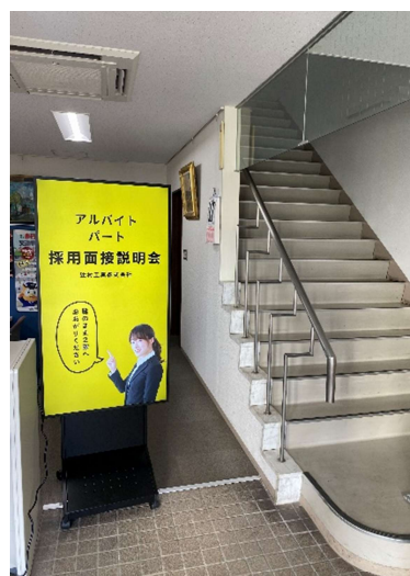
構成事業主企業での活用事例