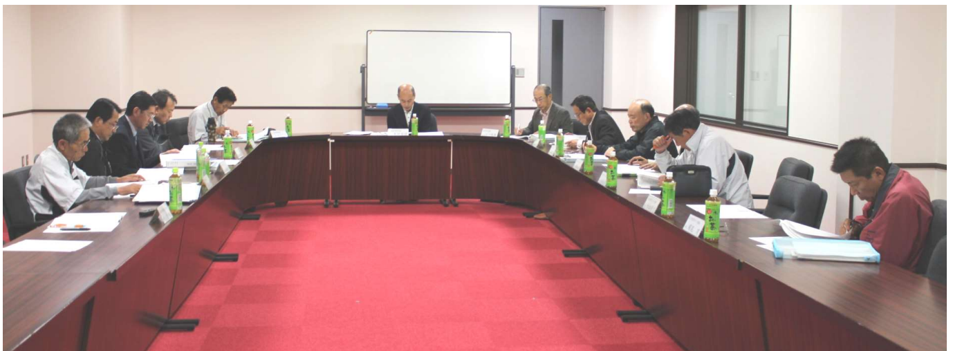
常任理事会で審議風景

西尾市体育協会が、スポーツを通じて市民により貢献できるようこれからも一致団結して努力してまいります。